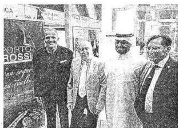
LO SCEICCO AL THANI E IL PRESIDENTE CROCETTA

Il Qatar ha un milione e 750 mila abitanti, la capitale Doha ne fa 400 mila. La Fiera dov'era? Tutti la descrivono come una